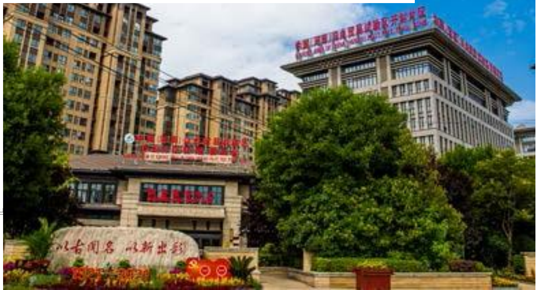
中国（河南） 自由贸易试验区开封片 区