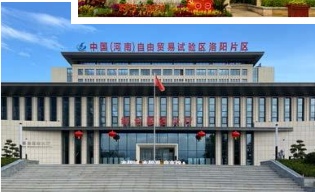
中国（河南） 自由贸易试验区 洛阳片区